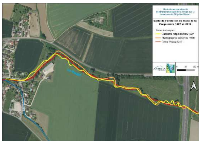
Evolution du tracé de la Vouge à Gilly-lès-Cîteaux au cours des deux derniers siècles

Les deux premières phases (état des lieux/diagnostic et scénarios d'aménagement) de la Vouge ont permis au comité de pilotage de décider du choix d'aménagement futur de la rivière entre la sortie du village et l'autoroute A31.