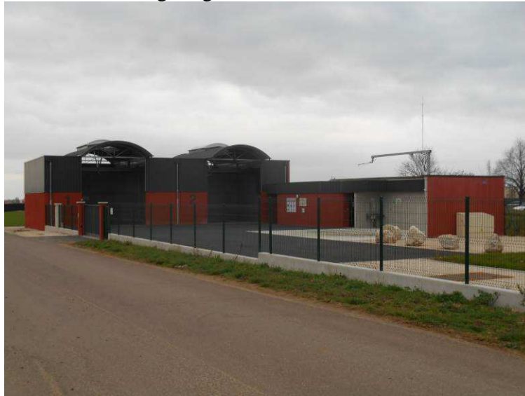
Aire de lavage viticole de Brochon - novembre 2015