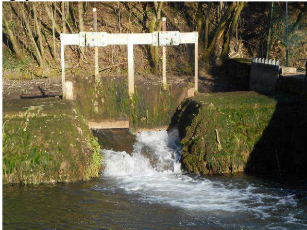
Vannes du Moulin aux Moines - décembre 2015