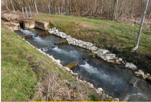
Moulin des Etangs – mars 2016