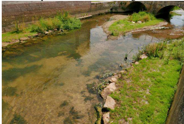
Banquettes réhabilitées - juin 2015