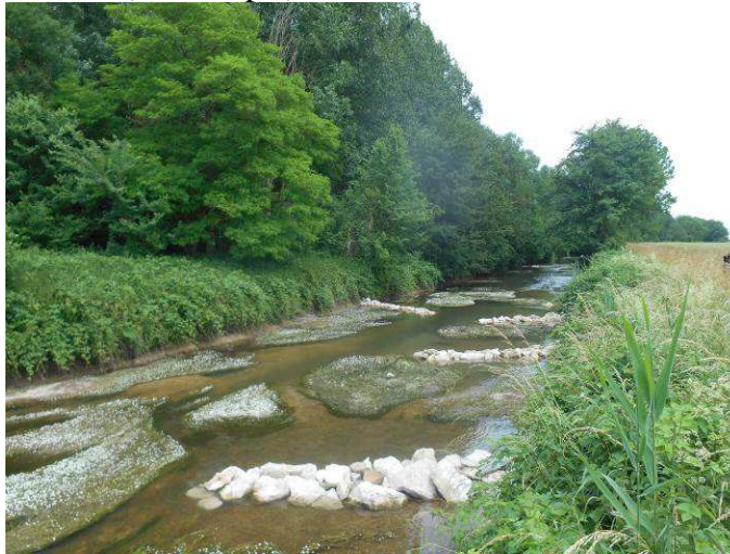
Installation d'épis minéraux sur la Vouge à Esbarres – juin 2015