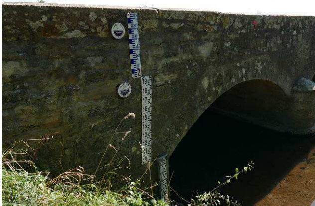
Pont de Tarsul – Izeure – septembre 2015