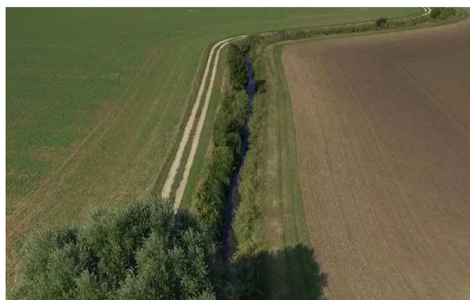
La Varaude : tristement rectiligne !

Ainsi, vous pourrez découvrir, grâce à des images aériennes prises par un drone, le manque évident de diversité morphologique et le tracé rectiligne de deux tronçons de cours d'eau sur lesquels, le SBV souhaite intervenir.