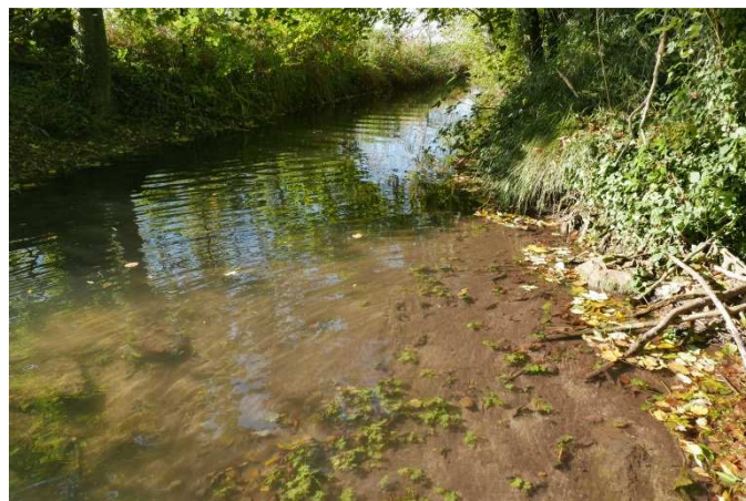
Le Cent Fonts sous l'effet du remous du moulin Bruet

D'ici quelques jours, le SBV va engager, en concertation avec le propriétaire, une opération similaire sur le Moulin Bruet, situé à Saulon la Rue. Cette démarche s'accompagnera d'une analyse de la morphologie de la Cent Fonts et de son amélioration. Ce deuxième point est une action prévue au contrat pour la protection de la nappe de Dijon Sud. Rappelons que ces actions, après réalisation des travaux, assureront les prélèvements en eau potable sur la nappe de Dijon Sud et la continuité écologique de la Cent Fonts de sa source jusqu'au Pont Aqueduc des Arvaux.