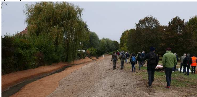
Visite du chantier de création de banquettes sur la Goulotte à Chevigny Saint Sauveur

A l'invitation de la Présidente du Syndicat du bassin de l'Ouche, quelques élus du SBV ont, le 13 octobre, découvert les actions entreprises sur l'Ouche mais également sur la Tille. Cette rencontre a permis aux représentants des quatre syndicats (SITNA, SITIV, SBO et SBV) de partager leurs expériences et de découvrir quelques travaux sur les autres bassins.